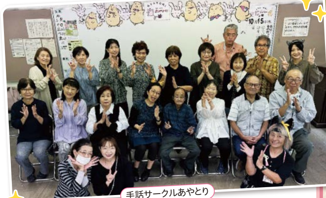
手話サークルあやとり

来年で団体設立35周年を迎えます。この間にメンバーの入れ替わりが多くありましたが、あやとりに関わった人たちが手話に関わる活動のきっかけになればと思います。いずれは手話通訳が不要な社会になってほしいと願っています。手話を特別に取り上げるものではなく自然とつながり合いが思いあえる社会になるようお願い地道に活動を続けていきたいと思っています。