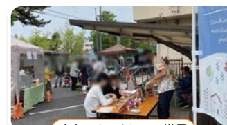
すまいるマルシェの様子