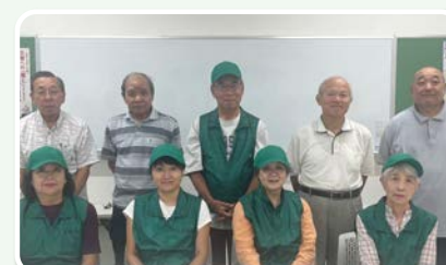
杉村学区地域支えあい事業メンバーの皆さま

*相談の内容によっては、対応できない場合もございます。詳細は、右にある二次元コードを読み取っていただき、本会ホームページよりご確認ください。