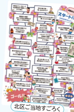
北区ご当地すごろく

*名古屋市社会福祉協議会のホームページに各区のものが掲載されていますのでぜひご覧ください。