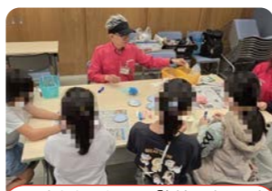
ソーネおそねにて「紙あじさい」を作成している様子

最近では中学生が会員になってくれました。ボランティアに興味のある方、現在こぐま会では会員募集をしています。そして、「こぐま会に来てほしい!」というご要望にもお応えいたします(内容応相談)!活動にご興味のある方は、北区社会福祉協議会までお問い合わせください。