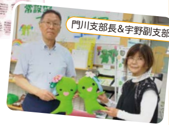
門川支部長&宇野副支部長