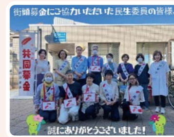
誠にありがとうございました!