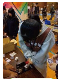
木工教室・大工体験