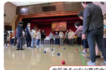
北区手をつなぐ育成会でのクリスマス会の様子