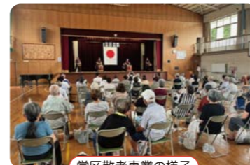
学区敬老事業の様子