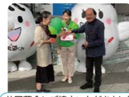
共同募金にご協力いただきました

本部ブースやスタンプラリー景品コーナーで 「きた福祉フェスティバル」を一緒に盛り上げていただける方大募集! 詳細は、北区社会福祉協議会まで!