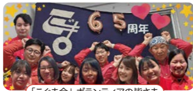
「こぐま会」ボランティアの皆さま