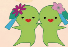
ふくちゃん・きたちゃん 北区社会福祉協議会マスコットキャラクター