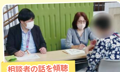
相談者の話を傾聴