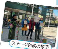
ステージ発表の様子