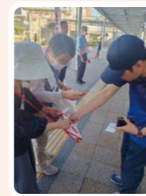
昨年度の大曽根駅での募金活動の様子