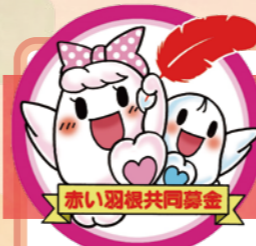
赤い羽根共同募金

10月1日より「北区のまちをよくするしくみ」 赤い羽根共同募金運動が始まります!