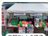
本部テントの様子

ご家庭にある手つかずの食品を持ち 寄り、必要な家庭に寄附します。 開封されていない、賞味期限が1ヶ月 以上ある缶詰・レトルト食品などです。 (生鮮食品や冷凍食品は不可)