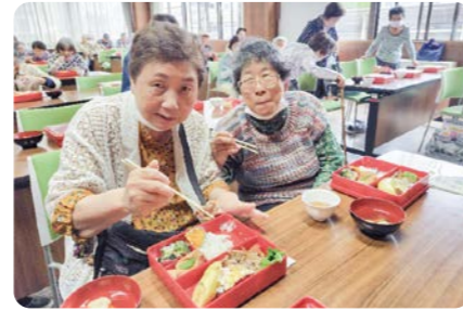
ふれあい給食サービス事業の様子