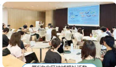
第5次北区地域福祉活動ワーキンググループ会議の様子