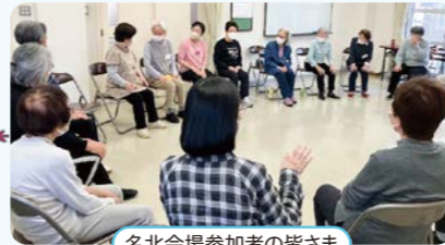
名北会場参加者の皆さま

フレンドリークラブ(高齢者はつつ長寿推進事業)は65歳以上の高齢者を対象とした介護予防の事業で区内8会場で開催しています。体操や物作り、脳トレ、歌などの活動を通し、介護予防・仲間づくりを目指します。