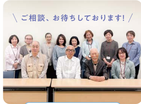
「ご相談、お待ちしております!」