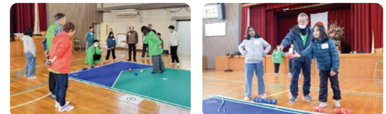
ボッチャ&交流会@飯田小学校の様子

このイベントは、多様な方々が互いに理解し合い、学びあえる関係づくりを目指す「地域で学びあえるしくみづくりプロジェクト」の一環として行われ、地域に新しいつながりが生まれる貴重な機会となりました。