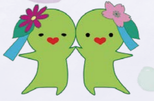
ふくちゃん・きたちゃん 北区社会福祉協議会マスコットキャラクター