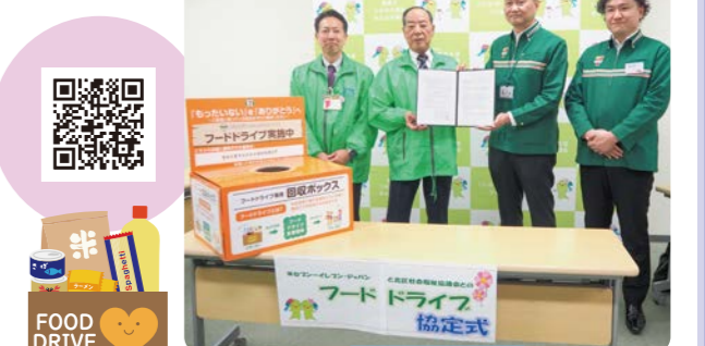
フードドライブ協定式

家庭にある余った食品を店舗にあるボックスに入れていただくことでの寄附となり、食品ロスを減らし、生活困窮者の支援に役立てる取り組みです。2月12日に協定式を行い、区内9店舗にて実施しております。店舗の詳細については、本会ホームページをご覧ください。