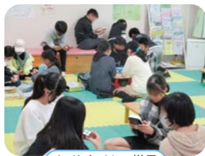
ナイトタイムの様子

※事故や災害時などに使用する緊急連絡先の登録が必要です。ご家族の連絡先を記入していただきます。