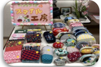
手づくり品いろいろ