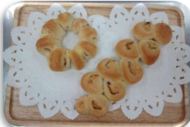
こだわりパンいろいろ