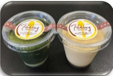
プリンやクッキーetc