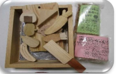
木工製品・みるコン etc