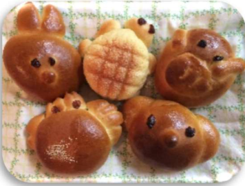
こだわりパンいろいろ