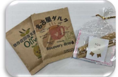
オリジナルコーヒー・香木 etc