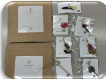
モリング製品・アクセサリーetc